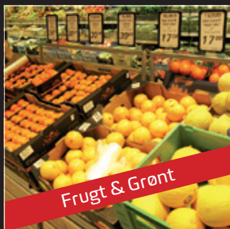
Frugt & Grønt