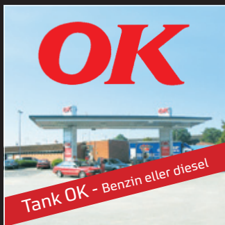
Tank OK - Benzin eller diesel