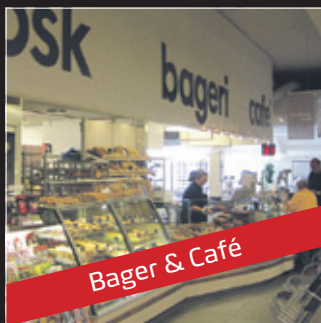
Bager & Café