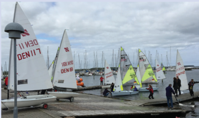
Slæbestedet til Sail Extreme.